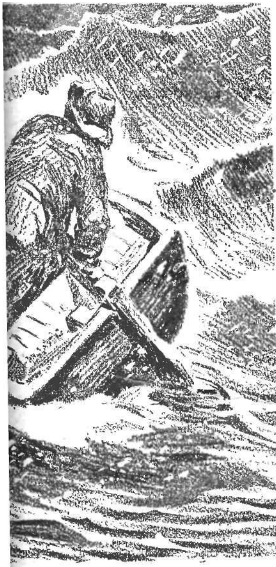
, накрыв атамана и Сагайдачного.

— Ну, спасибо, ребята!— с гордостью в голосе сказал Ванька-Каин. — Давайте еще дружнее поработаем. Отлежаться и отогреться хватит времени, а теперь гайда в море — камса идет!..