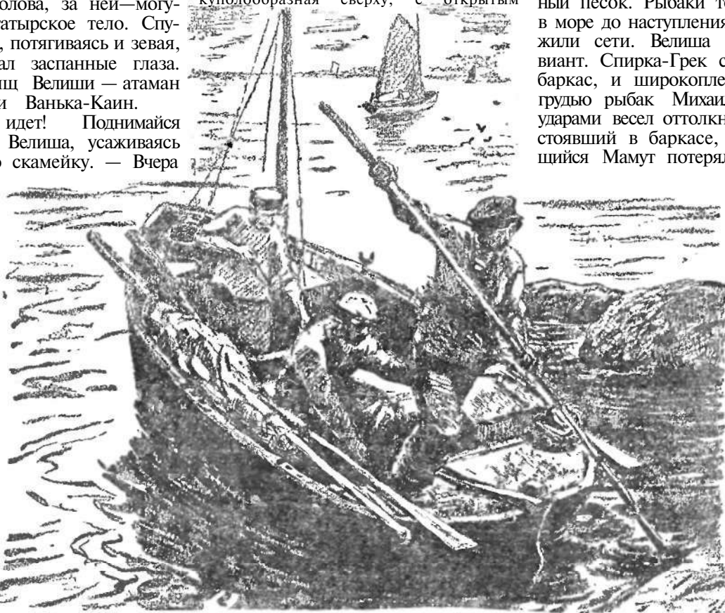
Рыбак Михаил оттолкнул баркас от берега.