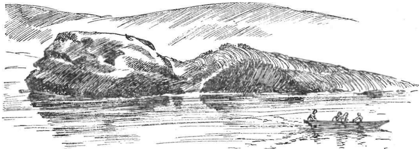
Против Таволжан вытянулся остров Перун

В этот момент сквозь неистовый рев воды послышался другой, ворчливый гул, будто от землетрясения или дальней грозы. Но небо было чисто. Гул повторился еще и еще. На этот раз отчетливо послышались толчки в воздухе. Стало ясно, что это взрывы. Там, за гранитной грядой ворочался титан-