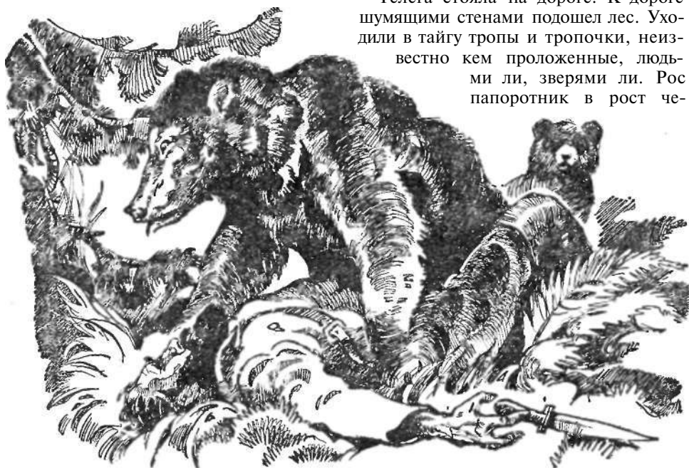
Черная масса надвинулась на Ольхова.

Озера разбросаны кусочками синего неба. Пади, крутизны, логи, таежники. Живут в лесу русские, орочены, манегры, гольды, ульча, неги дальцы, самагиры, ороки и пришлые с юга племена яо, мяо-це и си-факсей с неведомыми лингвистам языками, с тысячетлетней историей и потерянными во мраке времен расовым началом. Охотятся на харгу — гималайскую куницу, рысь, тигров, горалей — амурских антилоп — лосей, зайцев — с ружьями кремневыми, шомпольными и новейшими винчестерами. Одеваются в шкуры зверей, в рыбы кожи, в кору деревьев. Поклоняются и богу, и богам, и боженькам. Ставят силки, кулемки, слои-