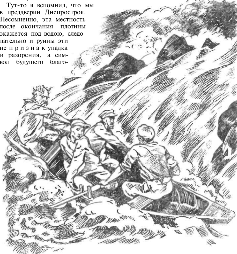
Лодка повернулась и стала поперек протока.