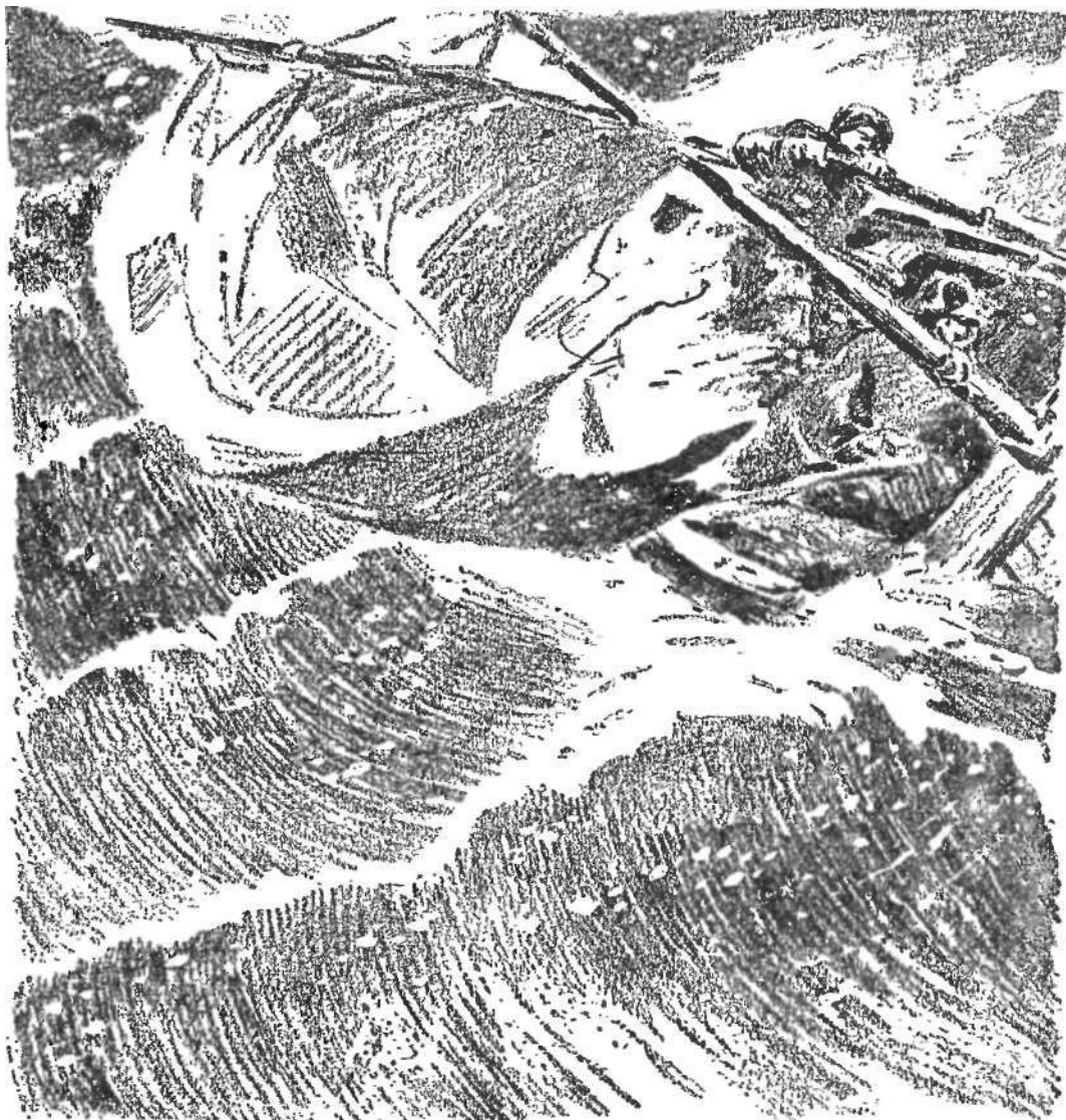
Мачта с полотнищем паруса прилипла

За поворотом уже все рыбаки ощутили запах дыма.