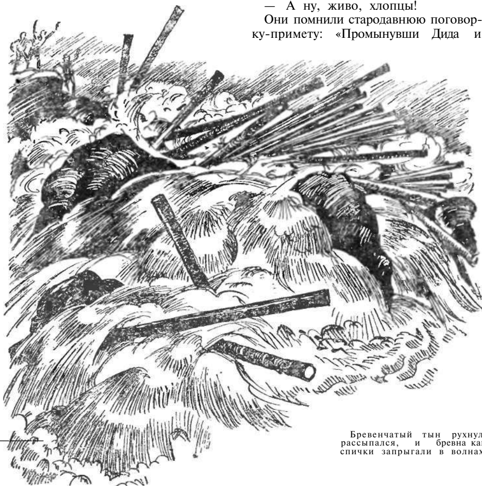
Бревенчатый тын рухнул, рассыпался, и бревна как спички запрыгали в волнах.

Они помнили стародавнюю поговорку-примету: «Промынувши Диду и