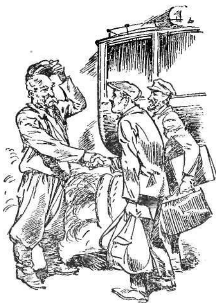
Мы тоже понимающе хохотали, пожимая руку старому лоцману

— Для вас приготовили мостки? А ну, живо выметайтесь, граждане!—