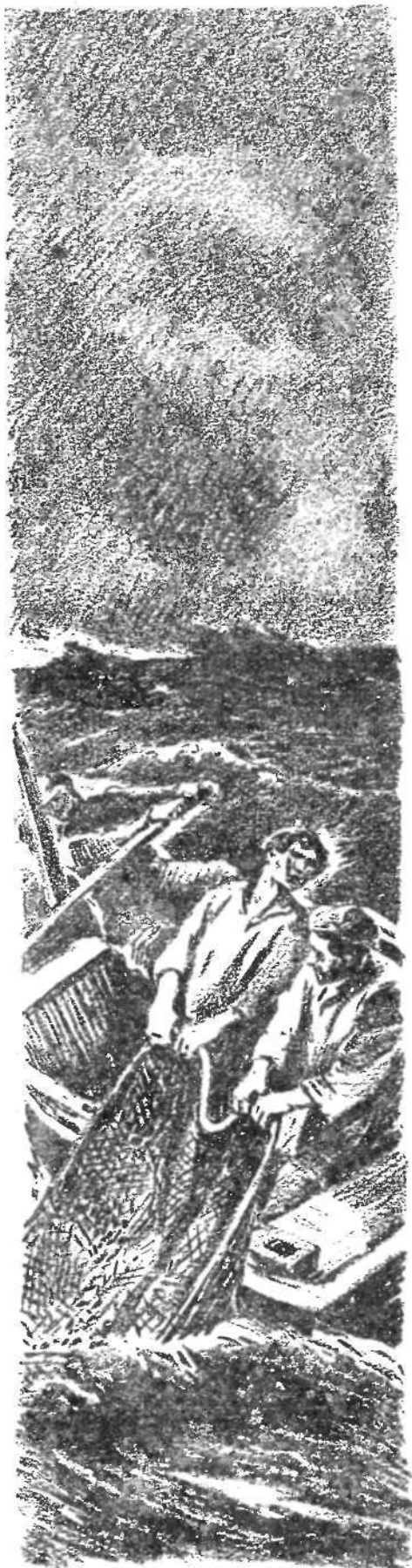
«По-малу!» — командовал атаман, и рыбаки осторожно частями подтягивали камсерос.