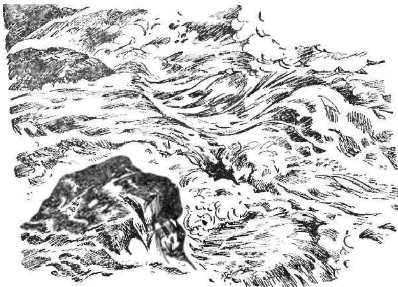
Пекло — одна из страшных лавин Ненасытца.

лос повисли на каждом подводном клыке. Двенадцать пенных лавин исполосовали его от края и до края. И горе тому лодману, рука которого дрогнет в решительную минуту!..