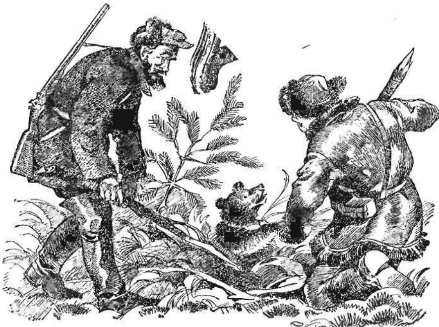
С помощью веток и палок был вытащен бедный Урру.

Медведица ткнула нос в землю и почувствовала раздражающий запах человека. Он был здесь совсем недавно и пошел по краю этого лога воина тот холм, а оттуда спустился в лес и по тропочке направился на север. С севера пахнет дымом. Но человек не мог далеко уйти. Хуже всего запах дегтя. Зачем человек мажет себя дегтем? Запах бесит медведицу. Она кружится вокруг кучи хвороста и валежника. Где Урру? Уж не человек ли утащил его? Вперед! В погоню! Медведица прикладывает уши к голове, вздымает на спине шерсть и в слепой ярости со скоростью мчащейся в испуге лошади бросается по следам человека.